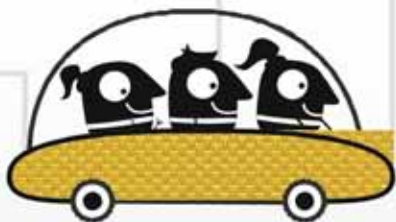
Formación de equipos